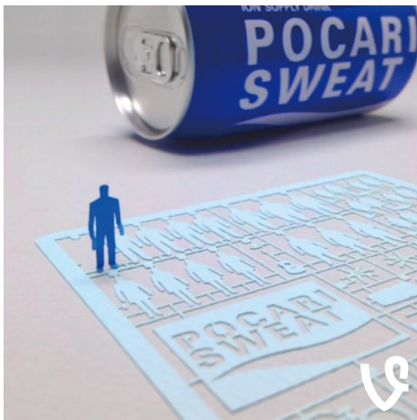
渴ききったニッポンのサラリーマンを演じる。6秒動画の「vine」での配信だ。

WEBサイト http://pocarisweat.net/teradamokei/ プロジェクト始動!! Twitterアカウント https://twitter.com/terada_pocari