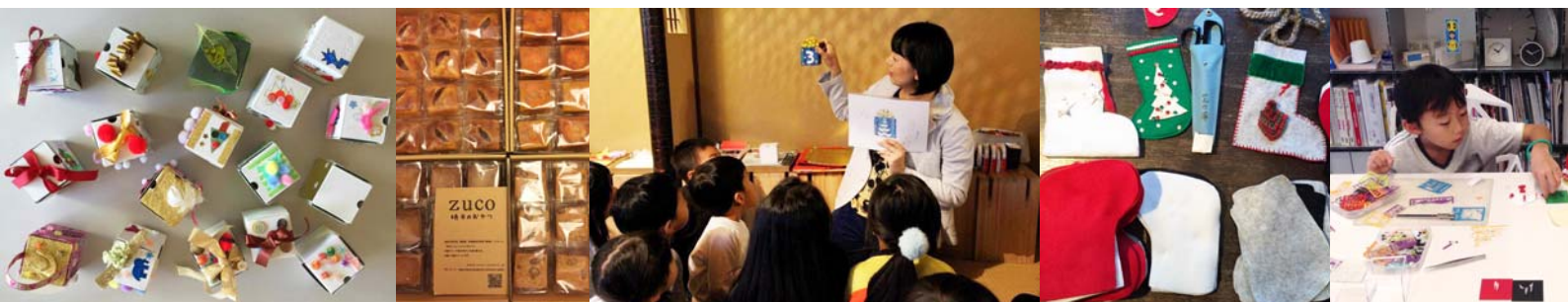
左から コドモチョウナイカイによるパッケージデザイン/ZUCO明日のおやつ/第1回コドモチョウナイカイ会議/「芝でこそ」のくつした作り/テラダモケイのワークショップ風景

行き方：神谷町より 日比谷線「神谷町」駅「3番」出口を出たら右方向 桜田通を北方向に直進(5分) 「虎ノ門三丁目」交差点を右折し 100mほどで右側に見えるフレッシュネスバーガーの左隣